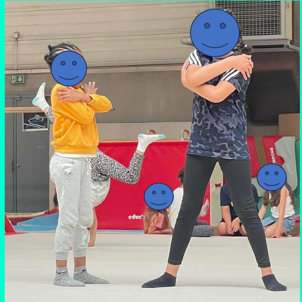
Les activités créatives : la danse