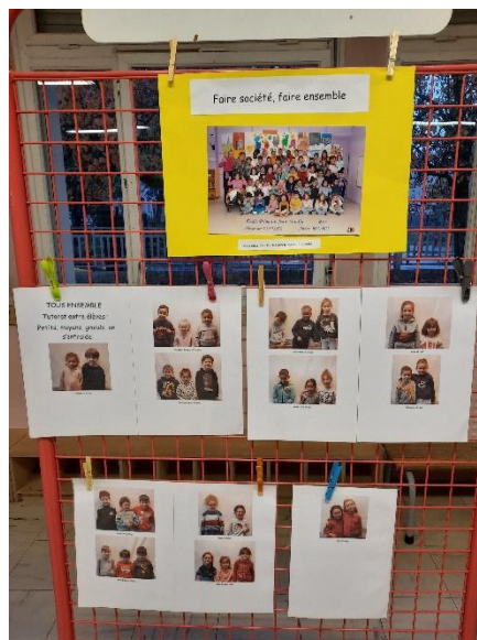
Tutorat entre élèves

La laïcité à l'école au quotidien : Faire société, faire ensemble.