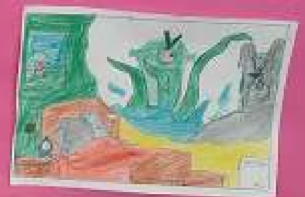
Lady est en train de regarder le ciel. Elle est en train de parler.