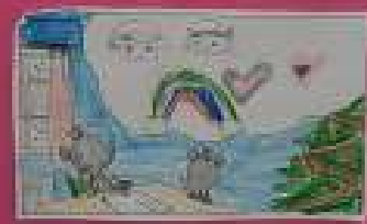
Lady est en train de regarder le ciel. Elle est en train de parler.