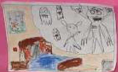
C'est à la fin de la journée. Lady est en train de regarder le ciel.