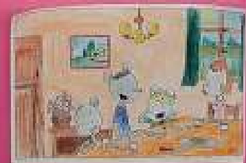
Lady est en train de regarder le ciel. Elle est en train de parler.