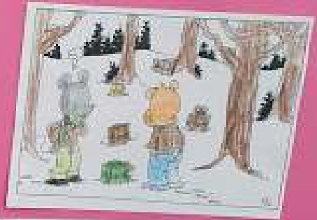
Lady et ses amis sont en train de regarder le ciel. Ils sont en train de parler.