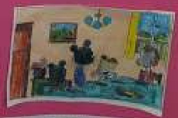
Lady est en train de regarder le ciel. Elle est en train de parler.