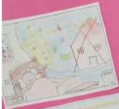
Lady est au milieu de la forêt. Elle est en train de regarder le ciel. Elle a peur.