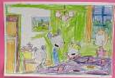
Lady est en train de regarder le ciel. Elle est en train de parler.