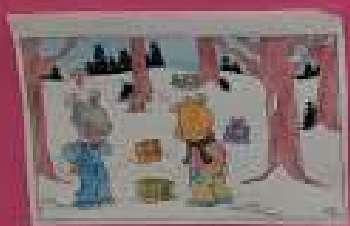
Lady est en train de regarder le ciel. Elle est en train de parler.