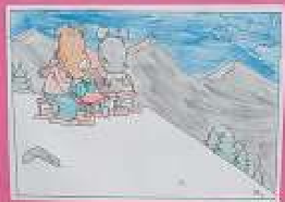
Lady et ses amis sont partis à la montagne. Ils sont en train de regarder le ciel et de parler.