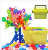
Connectors ou flocons